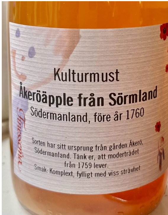
Figur 4. Must av "Åkeröäpple från Sörmland" klar för försäljning

Must produceras endast av råpressade äpplen av "Åkeröäpple från Sörmland". Musten framställs genom att färsk frukt krossas/rivs sönder och därefter pressas musten ur fruktköttet under högt tryck. Musten pastöriseras genom varsam upphettning för att uppnå lång hållbarhet. Must kan även säljas opastöriserad.