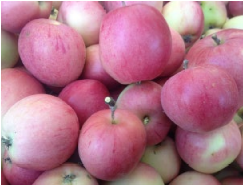
Figur 1. "Åkeröäpple från Sörmland"

Doft: Doften från skalet är stramt fräsch med träigt inslag, fruktköttet doftar fruktigt kryddigt åt kanelhållet med ett kärnhus som doftar moget blommigt.