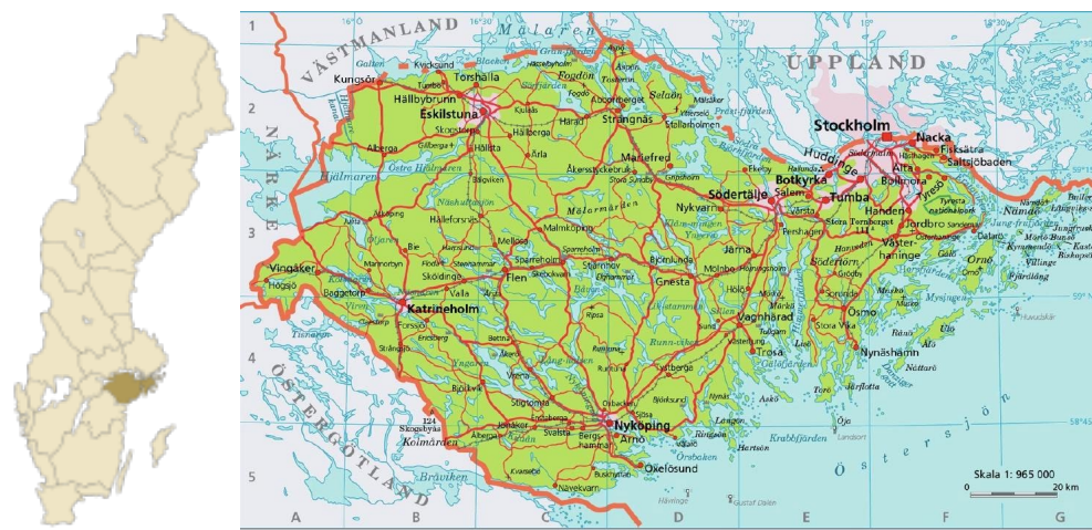
Figur 4. Landskapet Södermanland i mellersta Sverige.

"Åkeröpple från Sörmland" odlas inom det geografiska området landskapet Södermanland (figur 7).