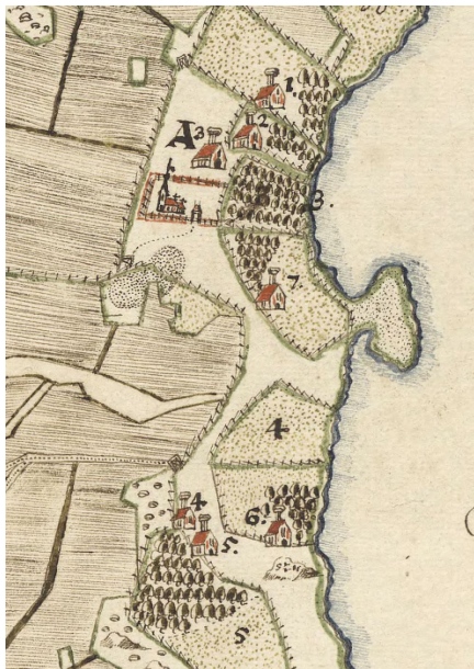
Figur 5. Fruktodlingar på de södermanländska Mäläröarna år 1640. Redan vid denna tid odlades frukt för avsalu till huvudstaden.

Under flera århundraden tilldelades stora gods i Södermanland var tids maktelit som belöning för insatser för riket och kungamakten. Den feudala maktordningen och de stora godsens utgjorde förutsättningar för mycket av det som idag ses som särpräglat sörmländskt. De stora gårdarna var uppbyggda som samhällen med stor arbetsstyrka. Det skapade förutsättningar för ett mångsidigt nyttjande av landskapets variation. Allt fanns och inte minst omfattande fruktodlingar. Skickliga trädgårdsmästare hade hög status och det är sannolikt ett skäl till att Södermanland har flest äldre kultursorter av äpplen bevarade. Ofta döpta efter namnet på den gård där de förädlats fram av skickliga hantverkare.