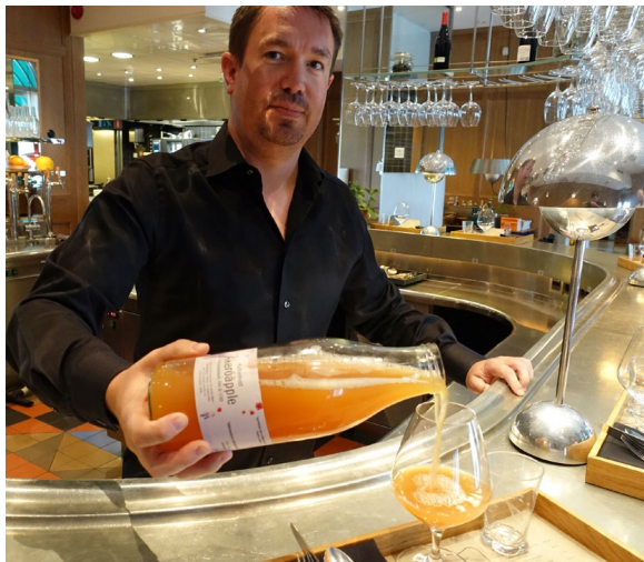
Figur 3. Must av "Åkeröpple från Sörmland" serverad på Restaurang Mathias Dahlgren, Grand Hôtel, Stockholm

Äpplen som är avsedda för förädling till must omfattas av alla krav i produktspecifikationen för färsk frukt utom klass och storlek. Dessa frukter får bära beteckningen "Åkeröpple från Sörmland" när odlaren förädlar egen odlad frukt till must.